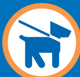
Animal de compagnie