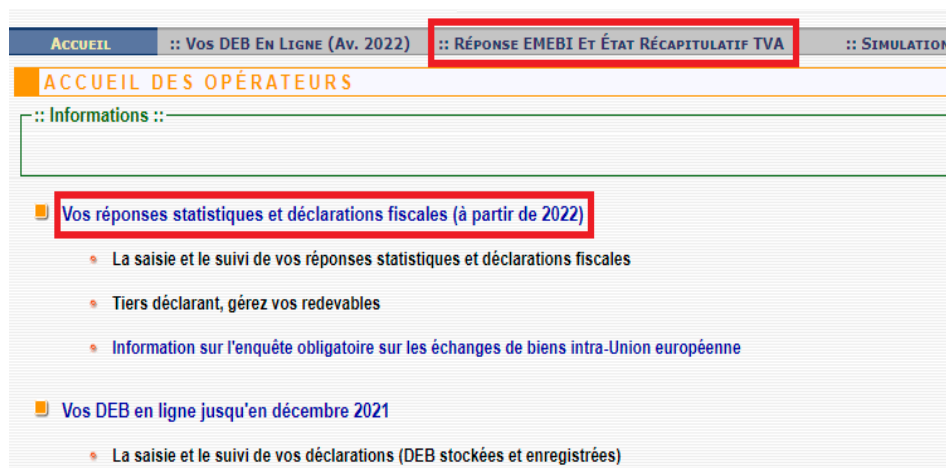
Illustration des menus

À partir de la page d'accueil, vous pourrez naviguer entre les différents outils qui vous sont proposés. Il vous suffira pour cela de cliquer sur l'option qui vous intéresse, soit en passant par la barre de menu horizontale située en haut de la page, soit en cliquant directement sur les liens de la page Écran de navigation.