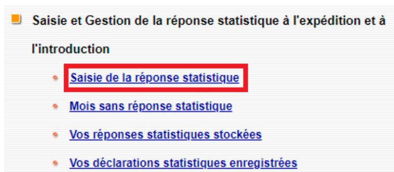
Écran de gestion des déclarations.