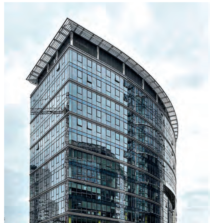
Bâtiment de Frontex, Varsovie (Pologne)

Toujours dans la poursuite de recherche de synergies, l'état des lieux de la coopération avec l'agence Frontex, et donc in fine avec les autorités nationales chargées de la gestion des frontières extérieures de l'UE, a permis d'engager une réflexion entre États membres pour renforcer la dimension stratégique de cette coopération et mieux prendre en compte les enjeux douaniers dans la gestion intégrée des frontières, notamment à la lumière de l'élargissement du mandat de l'agence à la lutte contre la criminalité transfrontalière.