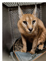
Caracal saisi par la Douane française