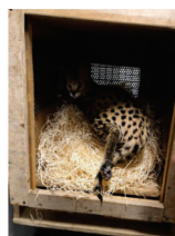
Serval saisi par la Douane française

En octobre 2025, les enquêteurs de la Direction nationale du renseignement et des enquêtes douanières (DNRED) spécialisée dans le trafic d'espèces protégées par la Convention de Washington (dite CITES *) ont saisi chez un particulier en région parisienne, un caracal et un serval. L'individu avait jeté de son balcon le sac contenant les félins à l'arrivée des douaniers. Confiés aux soins de Paris puis à une structure d'accueil, ces animaux protégés se portent bien aujourd'hui.