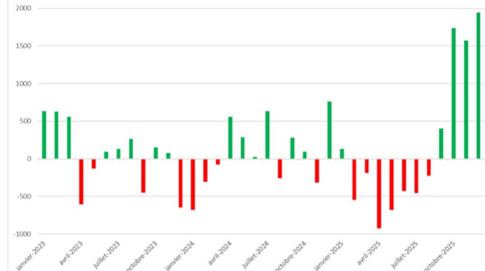
FIGURE 3 : ÉVOLUTION DU NOMBRE MENSUEL D'ENTREPRISES EXPORTATRICES VERS LES ÉTATS-UNIS, CALCULÉ EN GLISSEMENT ANNUEL

Champ : entreprises résidentes et non-résidentes. Note de lecture : en novembre 2025, le nombre d'entreprises exportant vers les États-Unis a augmenté de 1571 par rapport à novembre 2024.