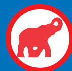
Espèces sauvages (animales ou végétales) menacées d'extinction