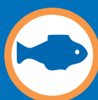
Denrées alimentaires (poisson, lait, ...)