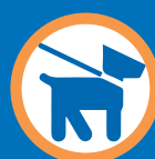
Animal de compagnie